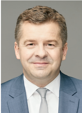
Sven Schulze | Minister für Wirtschaft, Tourismus, Landwirtschaft & Forsten Magdeburg, Januar 2024