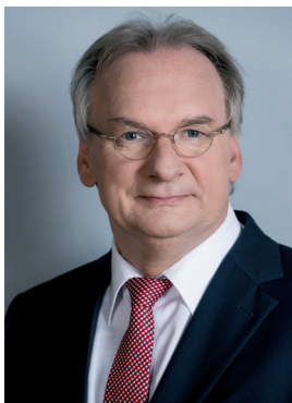
Dr. Reiner Haseloff Mdl Ministerpräsident des Landes Sachsen-Anhalt Magdeburg, Januar 2020